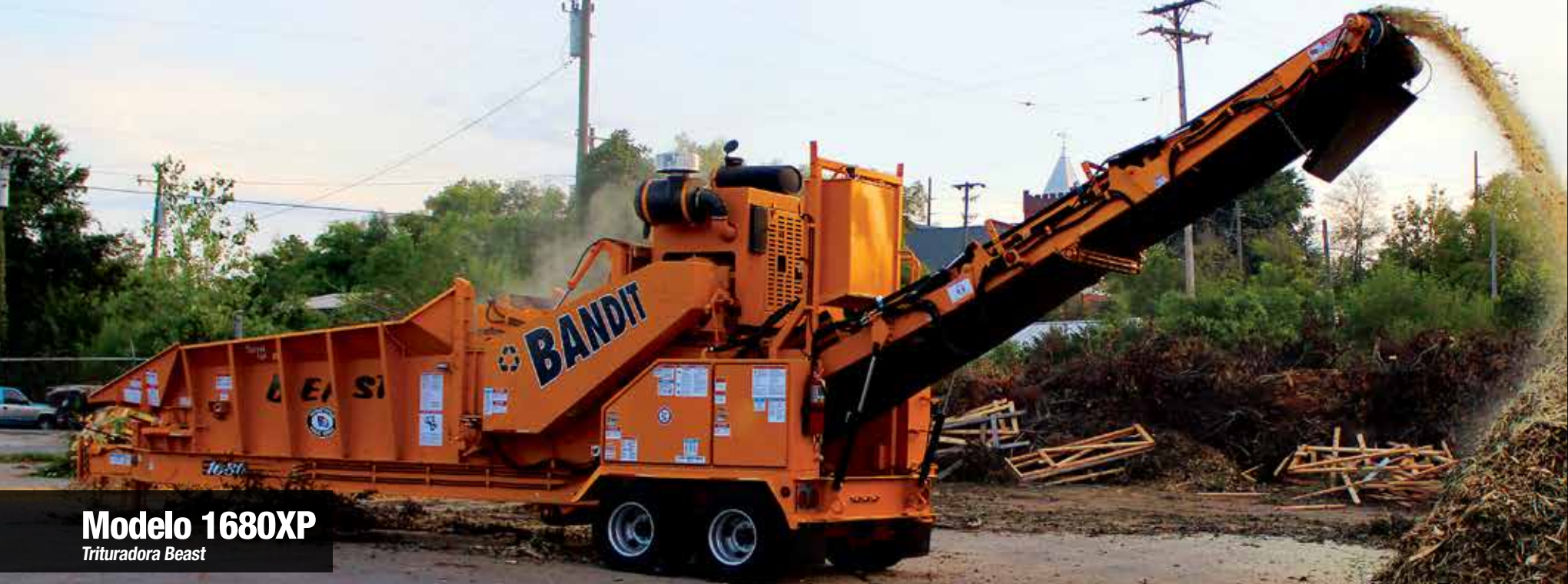
Modelo 1680XP Trituradora Beast