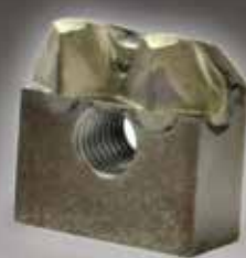
DOUBLE BLUNT NOSE SPLITTER