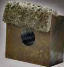
2" W G55 CARBIDE