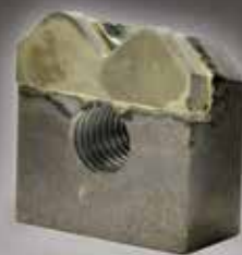
DOUBLE SHORT SHINGLE