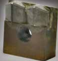
DOUBLE NR26 CARBIDE